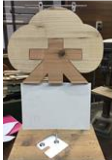
⑬ 木練がっこうメイン看板(165cm×70cm)