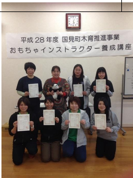
【アクティビティインストラクター養成講座】